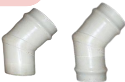
CODO 45° PARA PEGAR