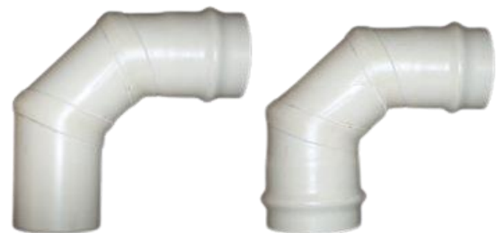
CODO 90° PARA PEGAR